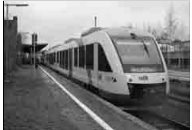
Die neuen Triebwagen der HLB anlässlich der Sternfahrt nach Alsfeld am 3.12.2011.