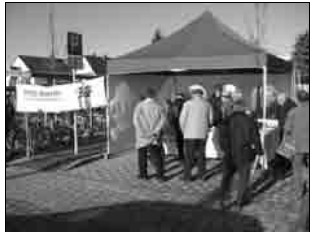
Auf reges Interesse stieß der PRO BAHN-Stand.

es natürlich auch einen Kreis derjenigen, die lieber beim Status Quo blieben. Interessant waren hier Aussagen, daß man lieber 40 Minuten mit Bus und Straßenbahn zum Darmstädter Hbf. führe als mit dem Zug in 12 Minuten. Ebenso wurden die neuen Busführungen in Pfungstadt kritisiert; hier gilt es aber wie immer abzuwarten, ob die Kritik berechtigt ist oder es sich nur um Mutmaßungen handelt.