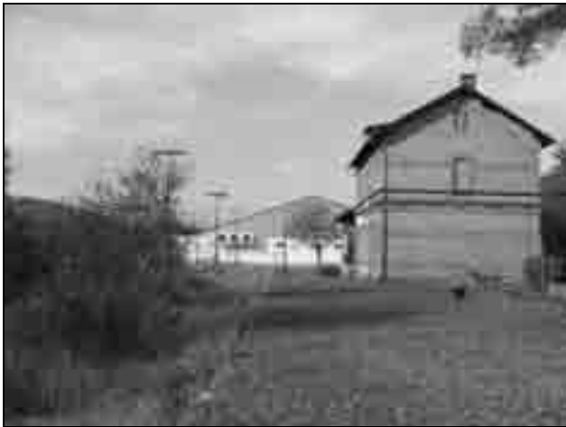
Der frühere Haltepunkt Lohra. Im Vordergrund rechts das inzwischen in Privatbesitz befindliche Bahngelände. Links sieht man das überwucherte Gleisbett, die Beleuchtungsmasten stehen hier noch. Im Hintergrund die komplett durch einen Supermarkt überbaute Bahntrasse.

Dass es wohl keine Reaktivierung mehr geben wird, ist nun auch an inzwischen geschaffenen baulichen Tatsachen. So steht z. B. im ehemaligen Bahnhofsbereich von Lohra einschließlich des ehemaligen Durchgangsgleises ein Einkaufsmarkt (siehe Bild). Einerseits steht entlang der ehemaligen Bahnstrecke noch Infrastruktur wie Schaltanlagen und Holzmasten. Es erscheint als sei der Gleisabbau spontan zu einem Zeitpunkt gekommen, als hätten noch andere Gedanken bei den Verantwortlichen bestanden. Im Verlauf von anderen Bahnstrecken erfolgte entweder vorher oder spätestens zum Gleisabbau auch der Rückbau der sonstigen Infrastruktur.