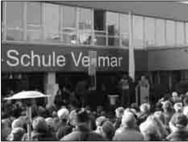
Eröffnungsrede mit Verkehrsminister Posch in Vellmar

Der Bau der neuen Strecke einschließlich des Umbaus der Wendeschleife Holländische Straße hat 37,7 Mio Euro gekostet. Das Land Hessen hat davon 28,6 Mio Euro getragen, die Stadt Vellmar vier Mio Euro, die Stadt Kassel 600 000 Euro, der NVV 500 000 Euro. Die KVG trägt den Rest von 4 Mio Euro.