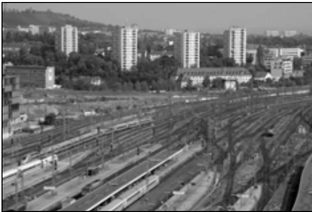
Das Gleisvorfeld des Stuttgarter Hauptbahnhofs – in zehn Jahren wird es wohl verschwunden sein.

seite zu entkräften. Überhaupt wurde von den S21-Befürwortern vor allem damit argumentiert, dass es zu teuer wäre, jetzt noch auszusteigen. Es kamen praktisch keine inhaltlichen Argumente für S21, sondern nur die Aussage „jetzt sind wir schon so weit – jetzt bauen wir zuende“.