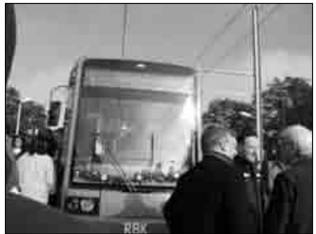
Jungfernfahrt in Vellmar

sowie eine Bike&Ride-Anlage mit Boxen und Bügeln für Fahrräder errichtet.