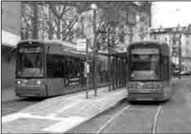
Das südliche Ende der Linie 18: Der Lokalbahnhof.

Auch wenn bis zuletzt unter Hochdruck gearbeitet wurde, fehlen noch einige Details an den Haltestellen, sind die Schaukästen oder die Leuchten noch provisorisch installiert. Auch die Begrünung und die Anlage an der Friedberger Warte müssen erst noch fertig gestellt werden.