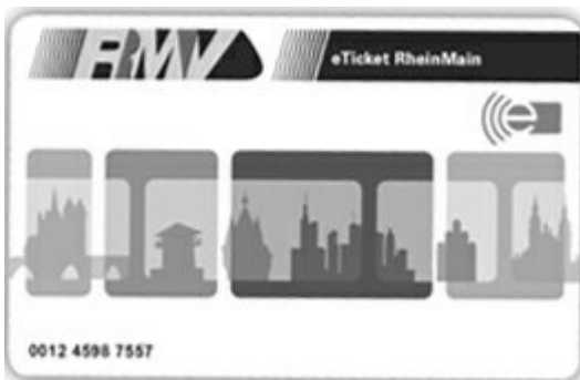
Logo eTicket

sperrt werden vom RMV auch Karten, deren monatliche Abbuchung fehlgeschlagen ist. Wer gerne dem RMV gegenüber anonym bleiben möchte, wählt den Barzahlermodus. Der Aufdruck des Namens erfolgt in diesem Fall nur auf ausdrücklichen Wunsch. Der Chip enthält generell nur die für die Abwicklung erforderlichen Daten. Bewegungsprofile können damit nicht erstellt werden. Die für den Datenschutz zuständigen Behörden haben bei dieser Version keine Bedenken angemeldet.