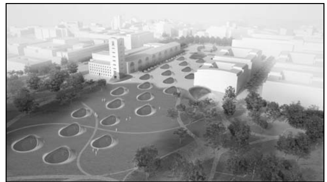
Hart gekämpft und doch verloren: Das eindeutige Nein der badischen Großstädte zu Stuttgart 21 konnte das Großprojekt nicht stoppen. Die Zeichnung zeigt den Stuttgarter Hauptbahnhof nach der Tieferlegung. (Abbildung: Deutsche Bahn AG/ingenhoven architects)

zahl her durchaus akzeptabel war. Allerdings waren diejenigen, die kamen, fast alle schon überzeugte S21-Gegner, so dass es kaum möglich war – wie ich gehofft hatte –, Unentschlossene zu überzeugen. Ein Großteil der Teilnehmer waren insbesondere örtlich aktive GRÜNE. Auch mit den Infoständen und persönlicher Ansprache in der Fußgängerzone konnten wir nur relativ wenige Leute erreichen. Viele winkten ab oder wichen aus. Unklar blieb, ob sie das Thema satt hatten, oder sich z. B. in der Sache zu unsicher fühlten, um sich auf ein Gespräch einzulassen. Obwohl wir die Themen „Baukosten“ und „Mögliche Ausstiegskosten“ fokussierten, sprangen nur wenige Passanten darauf an. Diese beiden Themen beschäftigten laut Umfragen die meisten in Ihrer Entscheidungsfindung – auf der Straße ließ sich das jedoch nicht nachvollziehen.