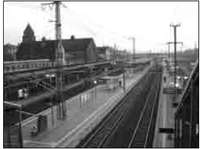
Der Bahnhof Gießen mit Blick von der Parkhaus-Bahnüberführung. Die Bahnsteige haben in großen Teilen keine Überdachung mehr.

Ganz aktuell ist für den Gießener Bahnhof noch ein anderes Problem aufgetaucht.